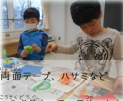
両面テープ、ハサミなど