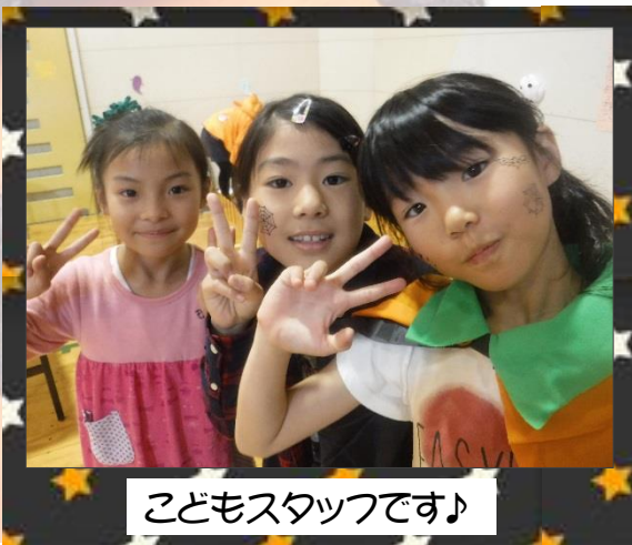
こどもスタッフです♪

10月28日(土)に、百合が原児童会館では、“ゆりあんまつり～ハッピーハロウィン2017～”が行われ、147名のおともだちの参加がありました。仮装をしてきてくれた子どもたちもたくさんいて、会場内はよりハロウィンらしくなりました♪おまつりの最後には毎年恒例のビンゴ大会もあり、大盛況のなか終わることができました♪その様子をご覧ください。