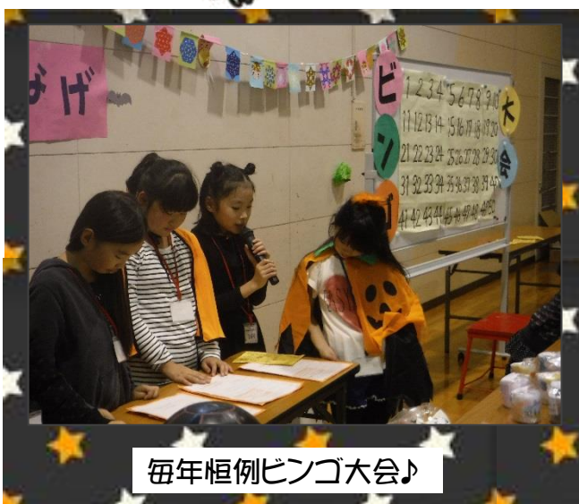
毎年恒例ビンゴ大会♪