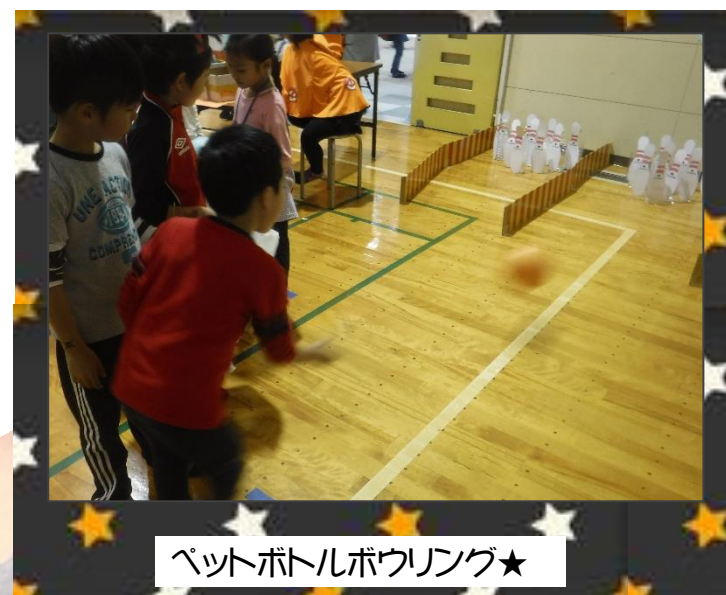
ペットボトルボウリング★