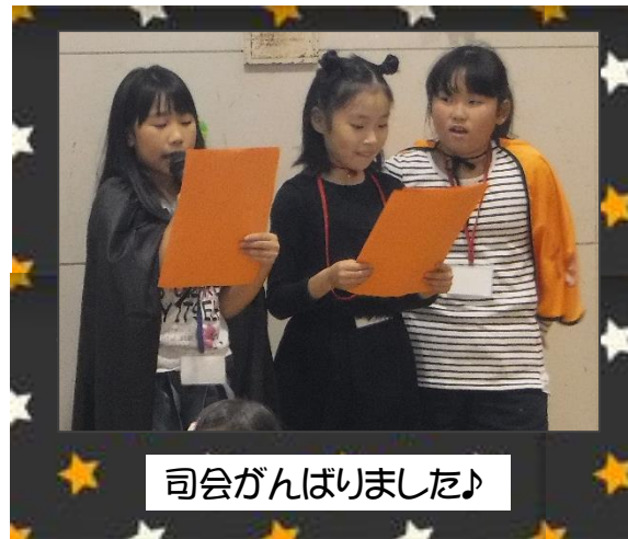
司会がんばりました♪