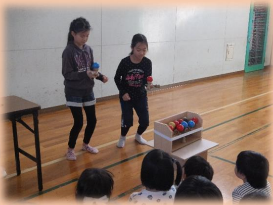
高学年がけん玉とコマのお手本を見せてくれました！！

平成 28 年 4 月 27 日（水）に札幌市エルムの森児童会館では、エルもい DE 体験～むかしあそび～を行いました。低学年 24 名、高学年 3 名の計 27 名の参加でしたが、1 年生が多く、遊びやすいものを考えて「けん玉」「こま遊び」「おりがみ（紙ヒコーキ）」「ストップウォッチ 5 秒止め」を行いました。中でも、おりがみは紙ヒコーキで誰が一番飛ばせるかプチ大会を行い、大いに盛り上がりました。むかしながらの遊びに興味をもった子どもたちは、「5 月から始まる検定をやりたい！」「できる遊びが増えてうれしい！」といった声がありました。