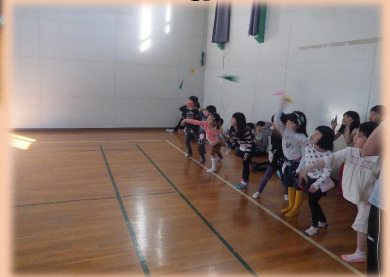
紙ヒコーキ飛ばし大会をしている様子です。1 年生はどの子も体育室の半分程度まで飛んでいて見ていた高学年も驚いてました！