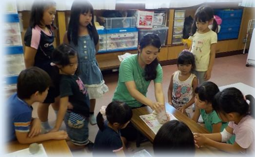
まずは、しっかり砂をこねましょう。