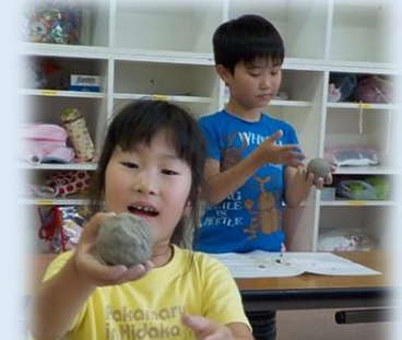
だんだん丸くなってきた！