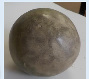
こんな感じにできあがりました。