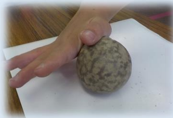
あれ、なんだか恐竜の卵みたいになってきたな・・・