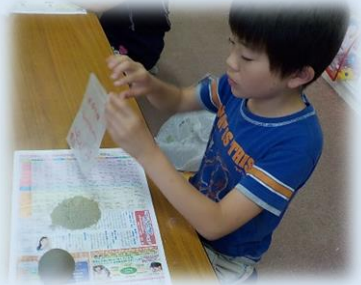
次は、サラサラの砂をきれいにつけていきます。